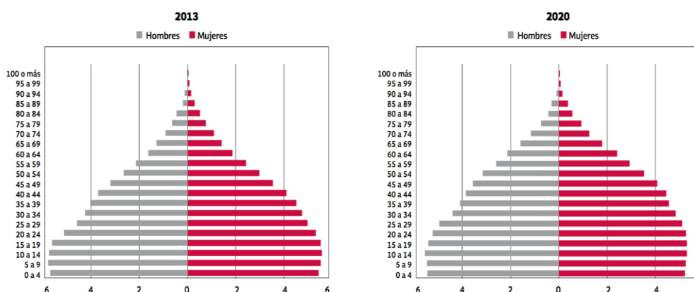
Gráfico 1. Pirámide poblacional de México 2013 y proyección para 2020. Consejo Nacional de Población CONAPO 2015.

En el caso de México, de acuerdo al Consejo Nacional de Población (CONAPO) para el año 2015, hay alrededor de 22'386,596 adolescentes con edades que van de los 10 a los 19 años, representando el 18.61% de la población total. Así mismo, la edad mediana para el inicio de la vida sexual es de 17.7 años. No obstante, llama la atención que la edad mediana para el uso del primer método anticonceptivo es 21.9 años; indicando una alta incidencia de embarazos en el segmento de población de 21 años y menos.